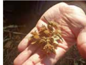
ブナの実の食べあと

なかなかその姿を現しませんが、秋は食べ物を求めて動物たちの動きが活発になり、その痕跡を見る機会は増えます。秋なら案外簡単に探せるかもしれません。