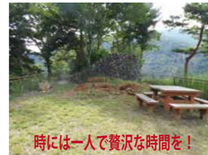
時には一人で贅沢な時間を!

アウトドアで読書、目を転じれば紅葉、風の音を聞きながら山の本を読んでみませんか? 山登りの開拓期に奥多摩などの山々を巡り調査した原全教、田辺重治などによる書は当時を偲ばせます。山の本では他に日本アルプスを世界に紹介したW. ウェストンの「日本アルプスの登山と探検」もおすすめ。