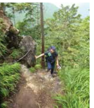
あとひと踏ん張り!