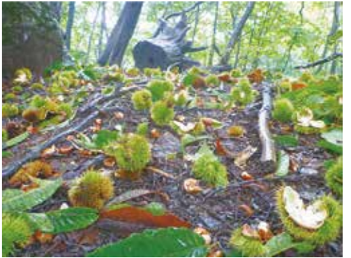
野生動物がクリを食べたあと