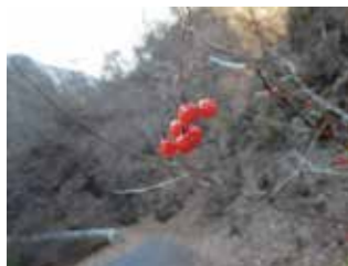
ヒヨドリジョウゴ

奥多摩にはいろいろな植物が生えています。秋には赤や青などの色鮮やかな実を付けます。実を食べに来た野鳥に出会えばラッキー! 実を探してみませんか?