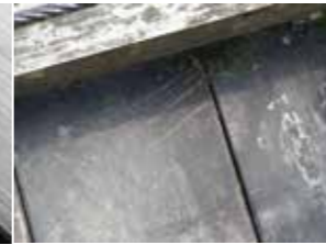
橋に付いたツメあと