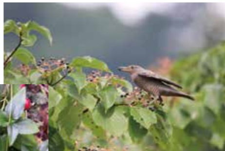
ミズキ(イソヒヨドリが実を食べに来たところ)

いかがでしたか、奥多摩オートム7。やり残しはまた来年! みんなで集まって君たちだけの新たな秋を見つけよう!